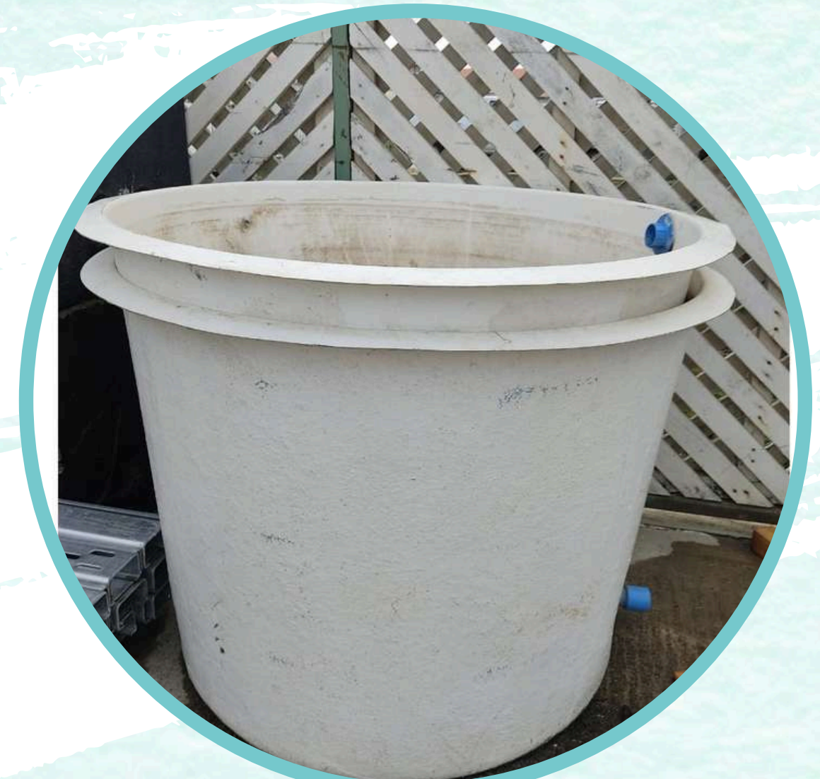
ESTANQUE DEPOSITO DE AGUA.