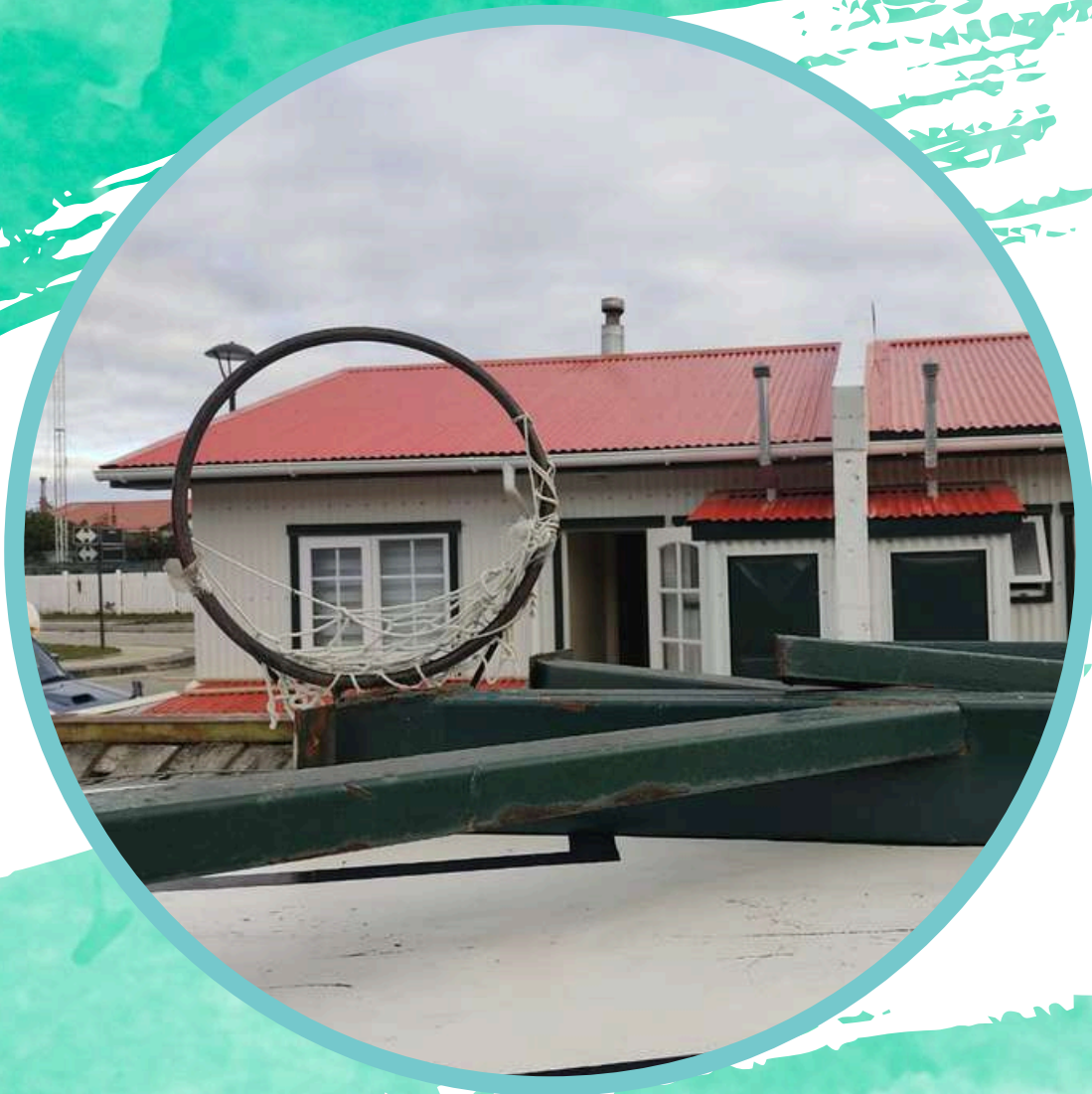
AROS DE BASQUETBALL.