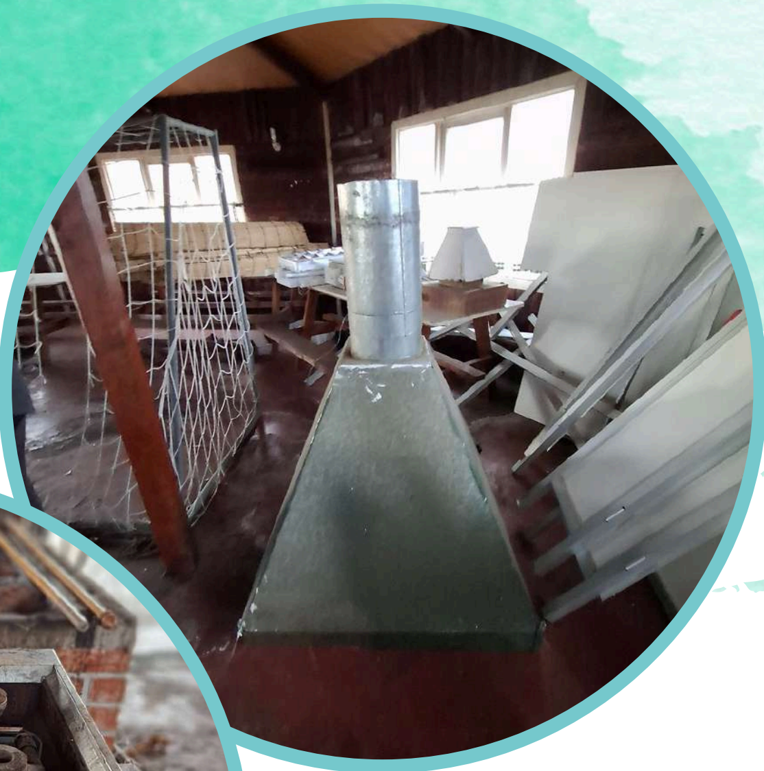
COCINA INDUSTRIAL + CAMPANA.