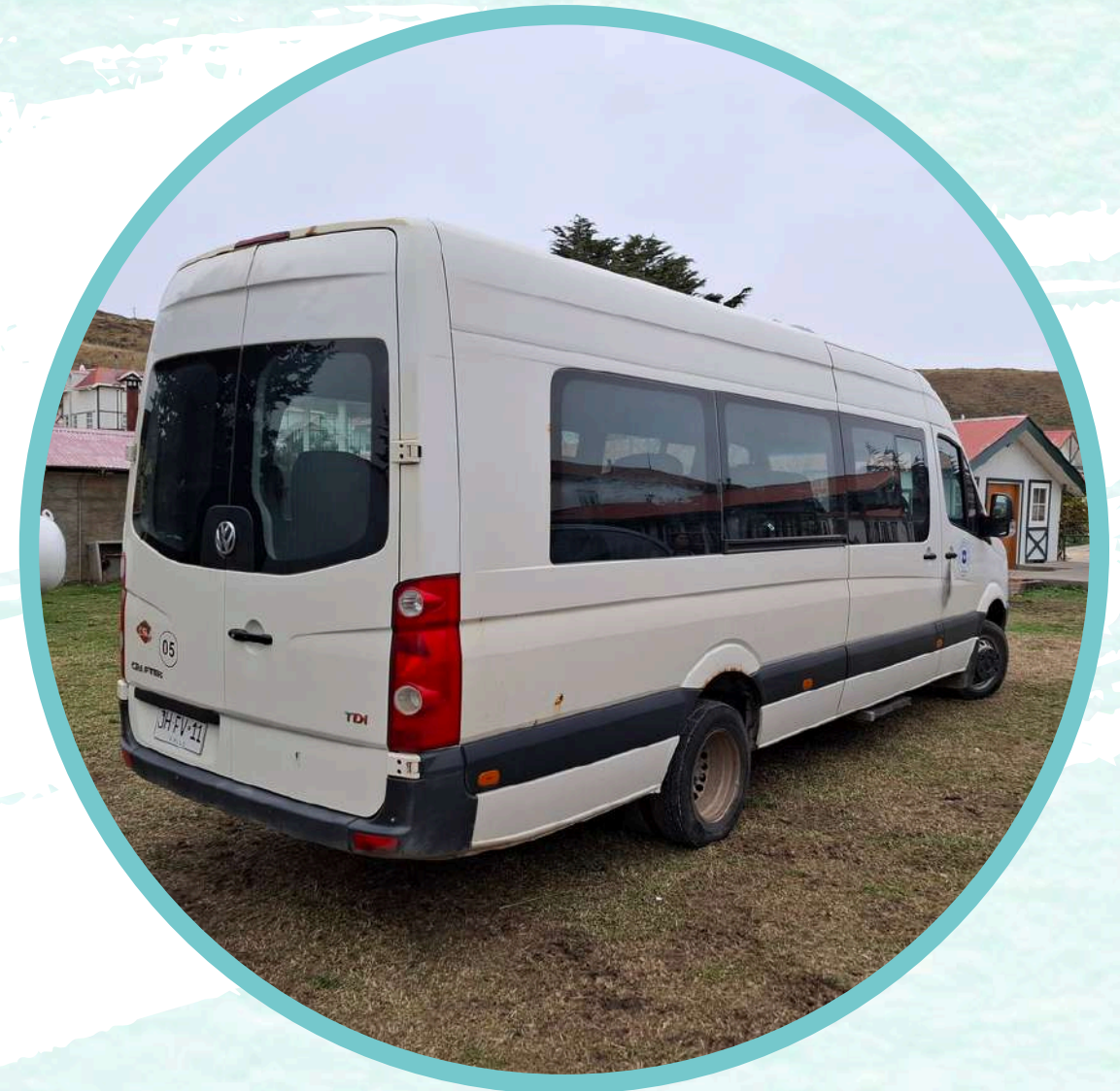
BUS VOLKSWAGEN, MODELO CRAFTER 50 LWBO, 2.0 DIESEL.