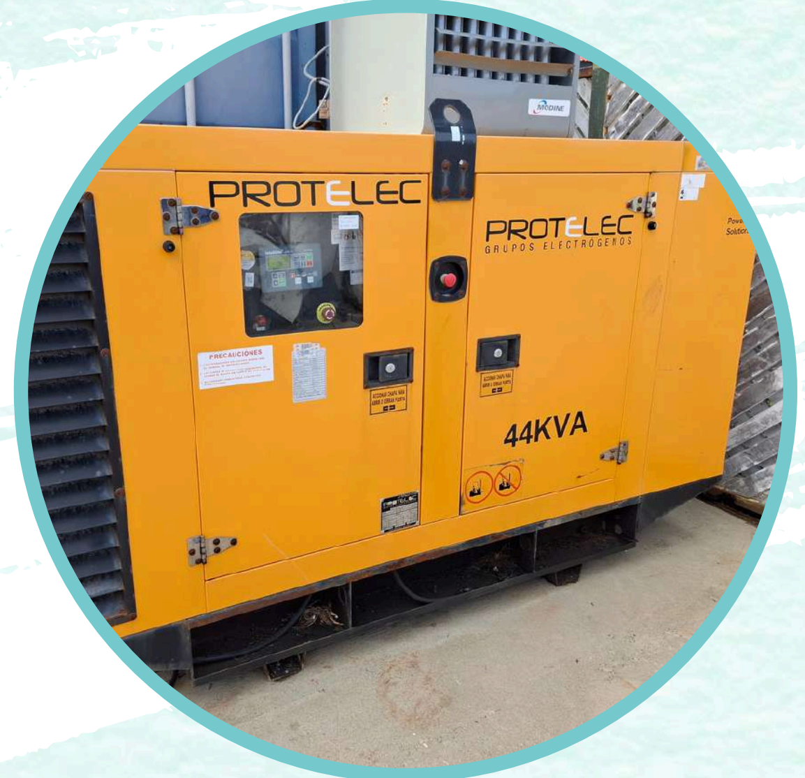
GRUPO ELECTRÓGENO PROTELEC.