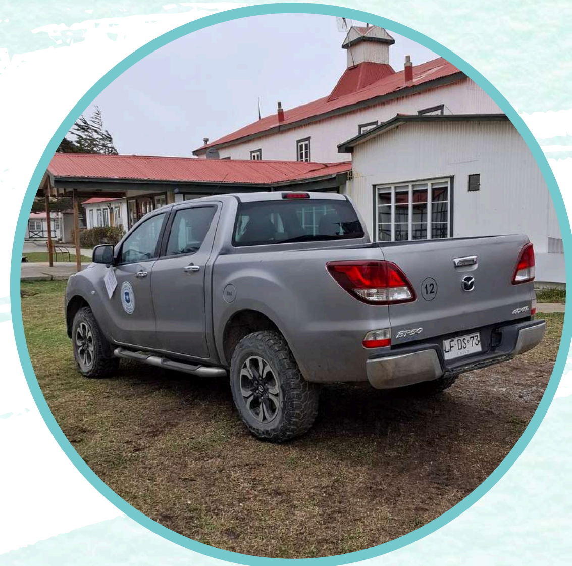
CAMIONETA MAZDA, MODELO NEW BT-50, 4X4, 2.2 DIESEL.